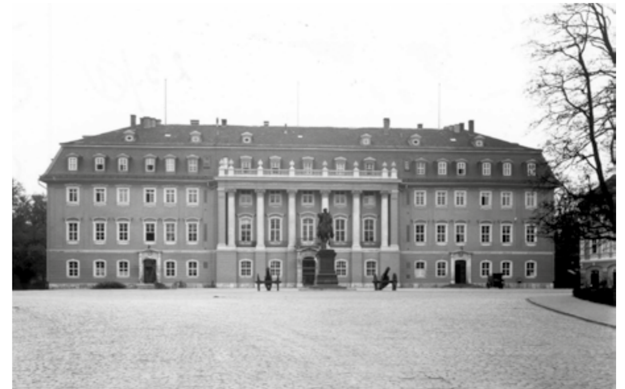
↓ Das Fürstenhaus in Weimar, Sitz des Thüringer Landtags, um 1919

verordnungen beschränken, machte aber Fortschritte bei der zunehmenden Integration der ehemaligen thüringischen Kleinstaaten. Die Ablehnung des Grundsteuergesetzes durch einen Teil der linken Abgeordneten und die Vertreter der Rechtsparteien führte schließlich zum Rücktritt der Regierung und Auflösung des Landtags im Juli 1921. Neuwahlen am 11. September 1921 führten Anfang Oktober zur Bildung einer Linksregierung, an der die DDP nicht mehr beteiligt war.