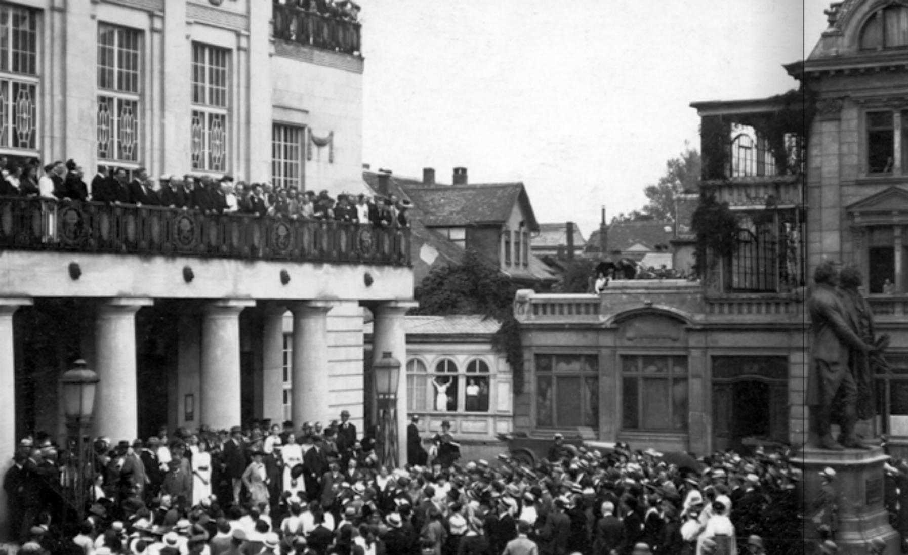
← Ansprache des Reichspräsidenten Friedrich Ebert vom Altan des Deutschen Nationaltheaters, 21.8.1919